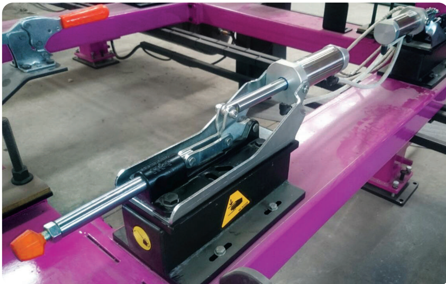
Cilindrico pneumatico a doppia azione, magnetico e con ammortizzatore Vérin à double effet : magnétique et avec amortisseur